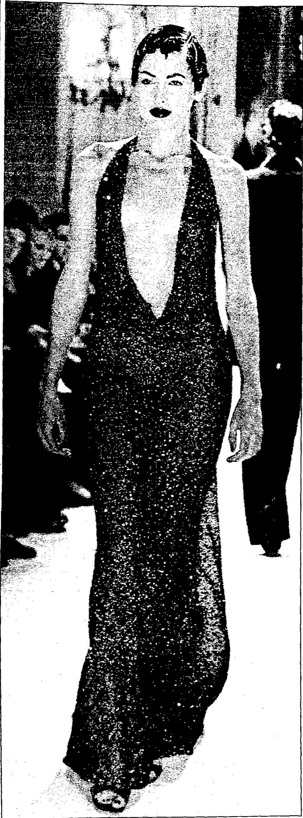
ضمن عرض اقيم في باريس لجموعات الملابس الجاهزة لوسمي الخريف والشتاء جاء هذا التصميم لفساتن سهرة مطرز للمصمم الفرنسي ستيفان رولان.

تايبه - رويترز: دعت وزارة الصحة في تايلاند المسافرين الى تايلاند لتلقي الحقن في اعقاب ظهور حالات كوليرا في هونغ كونغ يعتقد انها واردة من تايلاند.